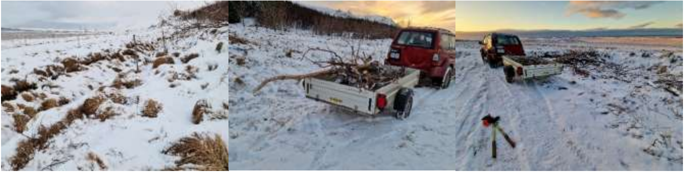
20. des. Grisjunarviður fjarlægður. Gömul girðing fjarlægð. Séð niður að uppeldissvæði úr hlíðinni fyrir ofan.