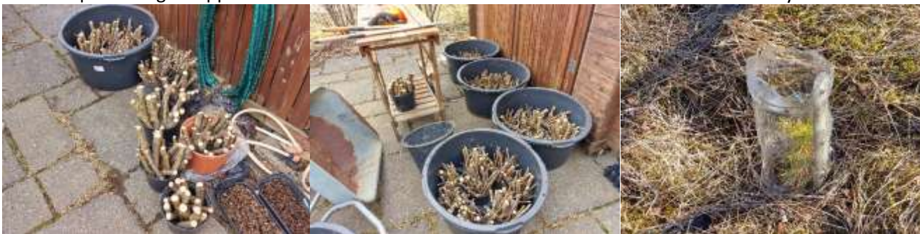
Apríl. Ónýtur víðir grisjaður á nýja uppeldissvæðinu í Slögu.